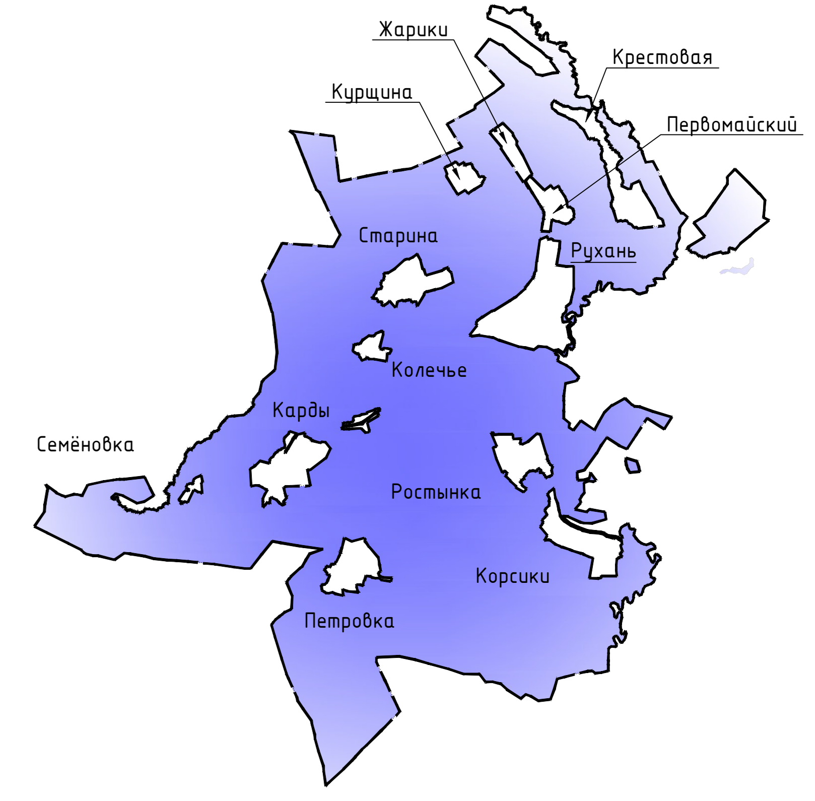
Схема расположения населенных пунктов на территории Руханского сельского поселения (ранее Руханское) Ершичского района Смоленской области

Примечание: 1. Данная карта выполнена с точностью 1:2000. 2. Информация от Департамента Смоленской области по культуре и туризму нанесена в соответствии с запросом №3871/08 от 04.09.2018 г. 3. Согласно статье 34.1 Федерального закона от 25.06.2002 №73-ФЗ (вступила в силу 3 октября 2016 года): защитные зоны не устанавливаются для объектов археологического наследия, некролей, захоронений, расположенных в границах населенных пунктов, произведений монументального искусства, а также памятников и объектов, расположенных в границах историко-культурного наследия. 4. Определение границ зон биосферы и прилегающих зон в соответствии с требованиями законодательства для различных геоэкологических условий проводится в соответствии с методикой геоэкологических расчетов. 5. В виду отсутствия точной географической информации о местонахождении скотоловильных, банные объекты отображены на схеме условными знаками и расположены в соответствии с описанием в предоставленных исходных данных. СЗ от них отображены ориентировочно, необходимо провести лабораторные исследования почвы на наличие спор возбудителей. 6. Улично-дорожная сеть сельских населенных пунктов дана на картах градостроительного зонирования. 7. Данный чертеж попадает под действие авторского права.